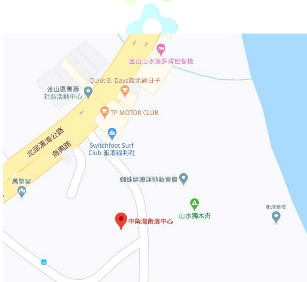
圖三。金山中角灣衝浪基地