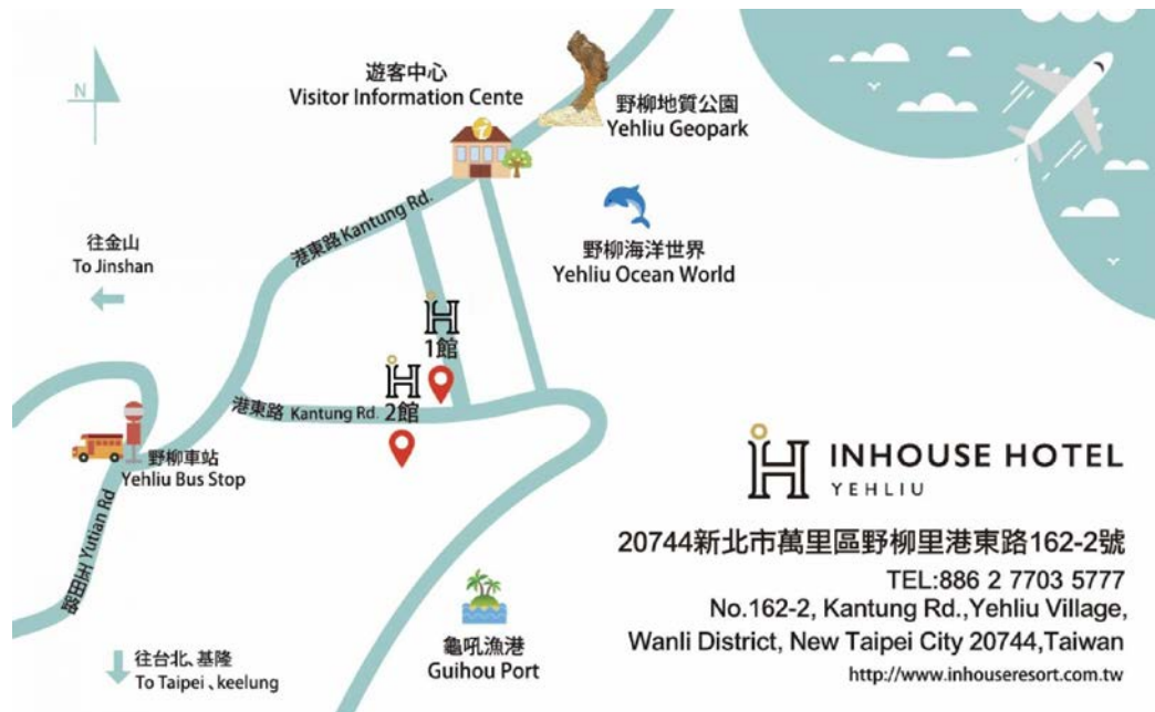
圖二。菱悅酒店周邊地圖